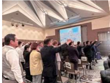
【岡山県青年部応援団】