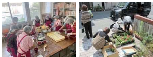
【和文字焼きまつりお弁当作り】

今後は、「和気町ふるさとまつり」への出店や、若手後継者等育成事業による「健康経営に関するセミナー」を実施予定であり、引き続き、女性部活動を推進していきます。